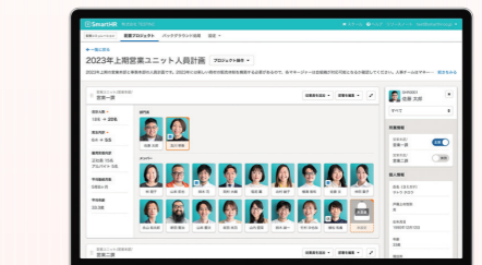
従業員の情報や顔写真を見ながら人員配置をシミュレーション