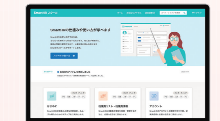
SmartHRの仕組みや使い方をウェブ上で学べる