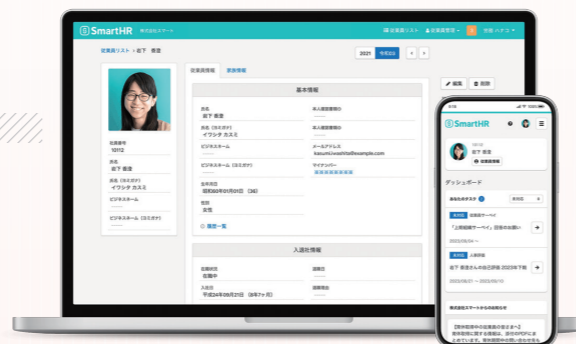
クラウド人事労務ソフト「SmartHR」の従業員情報画面

クラウド人事労務ソフト「SmartHR」は、創業者自身や家族の傷病手当金の申請・産育休などの手続きに苦労した経験をヒントに生まれました。企業の人事・労務手続きは煩雑な書類作成や役所への申請業務が多く、従業員も不慣れた書類への記入に手こずるケースが多くあります。当社は12回にもおよぶ事業転換のなか労務手続きの煩雑さという課題を見つけ、労務手続きをわかりやすく、ペーパーレスに行える「SmartHR」の開発・提供に至りました。現在では労務領域の課題解決から、働くにまつわるさまざまな課題解決へとミッションを広げ、タレントマネジメントをはじめとした多くの事業を展開し、“誰もがその人らしく働ける社会”の実現を目指しています。