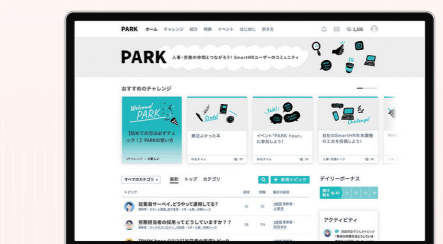
ユーザー同士が交流できるコミュニティ

「SmartHR」は、労務管理クラウド6年連続シェアNo.1*のクラウド人事労務ソフトです。雇用契約や入社手続き、年末調整などの多様な労務手続きをペーパーレス化し、データとして蓄積。さらに、「SmartHR」に溜まった従業員データを活用した「人事評価」「従業員サーベイ」「配置シミュレーション」「スキル管理」などのタレントマネジメント機能により、組織の活性化や組織変革を推進し生産性向上を支援しています。アプ