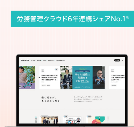
人事・労務に関する幅広い情報を提供するメディア